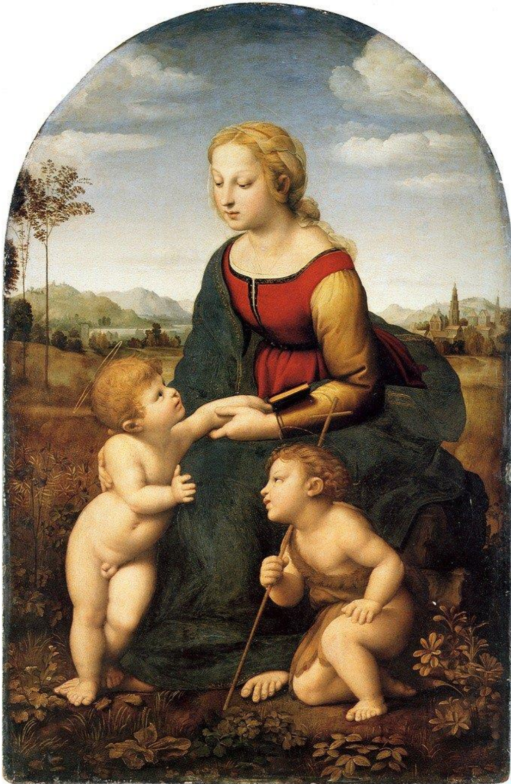
Rafael Sanzio: La bella jardinera , 1507, óleo sobre tabla, 122 cm × 80 cm, Museo del Louvre, París.